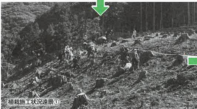
植栽施工状況遠景①