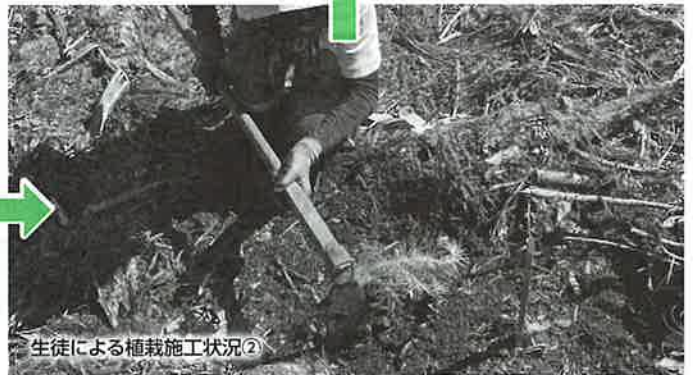
生徒による植栽施工状況②