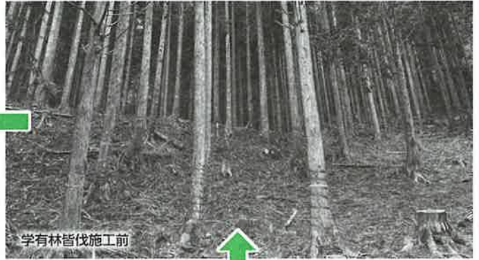
学有林皆伐施工前